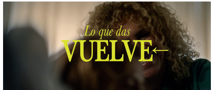
Campanya de l'Agència Tributària espanyola, octubre 2024

res de realitat virtual, càmeres de gravació 360 graus, webcams, micròfons de conferència, etc. ( www.extremadura.com , 10 gener 2024).