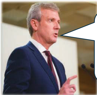
Alfonso Rueda, President de la Xunta de Galicia

La financiación singular para Cataluña haría perder a Galicia más de 450 millones de euros.