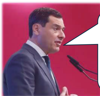
Juanma Moreno, President de la Junta de Andalucía

La financiación en Cataluña provocará que Castilla-La Mancha pierda 238 M€ lo que de legislatura hace un total de 714 M€.